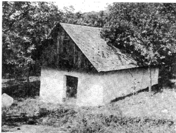
Uprkova buda, majitel Žofie Nevařilová-Zemková.